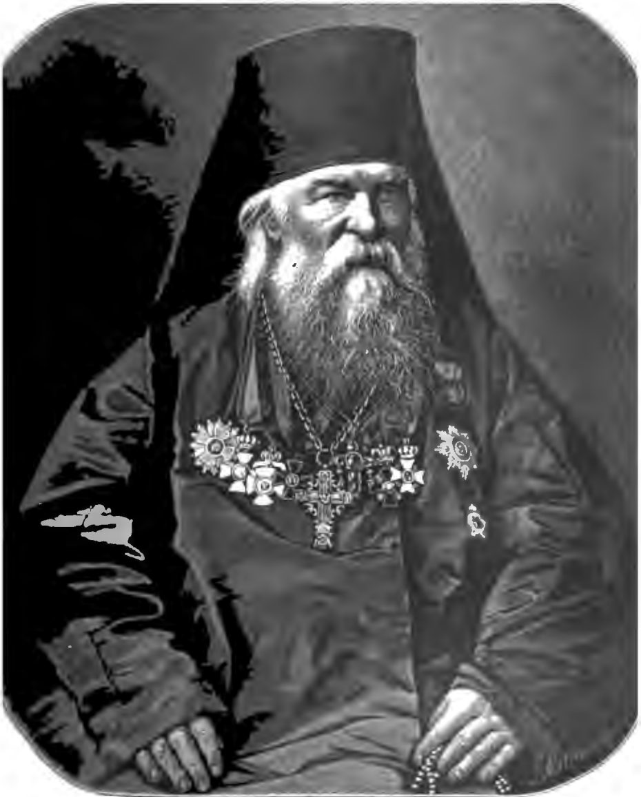
АРХИМАНДРИТЪ ИГНАТІЙ МАЛЫШЕВЪ, НАСТОЯТЕЛЬ СЕРГІЕВСКОЙ ПУСТЫНИ, СОСТАВИТЕЛЬ ПРОЕКТА ХРАМА ВОСКРЕСЕНІЯ ХРИСТОВА ВЪ С.-ПЕТЕРБУРГѢ НА МѢСТѢ СОВМѢТІЯ 1-ГО МАРТА 1881 Г.