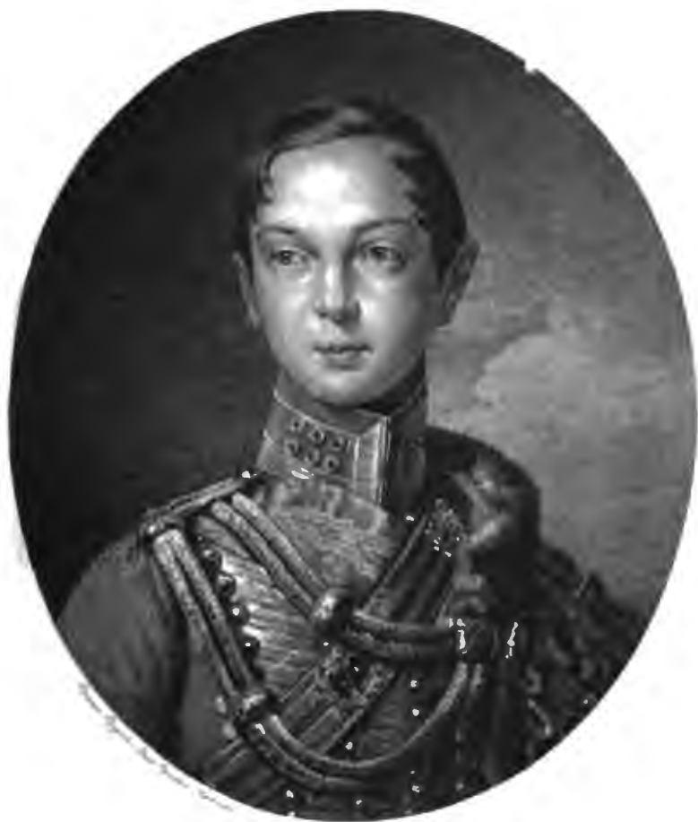
НАСЛѢДНИКЪ ЦЕСАРЕВИЧЪ АЛЕКСАНДРЪ НИКОЛАЕВИЧЪ ВЪ 1833 Г.